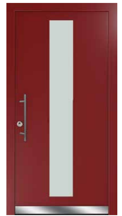
Modell 515 mit Designsockel Glas Satina weiß Griff SG 135 Farbe RAL 3004 Purpurrot

Die Abbildung zeigt eine zusätzliche Ausstattung mit Mehrpreis: SG 136.