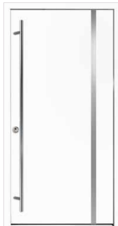
Modell 502 mit Edelstahlapplikation ohne Designsockel Griff SG 136 Farbe RAL 9016 Weiß

Ohne Mehrpreis als Sicherheitstür mit Widerstandsklasse RC2 (nur mit Griff SKDZ 601)