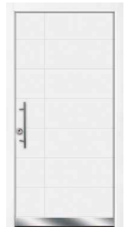
Modell 807 mit Designsockel Griff SG 135 Farbe RAL 9016 Weiß

Ohne Mehrpreis als Sicherheitstür mit Widerstandsklasse RC2 (nur mit Griff SKDZ 601)