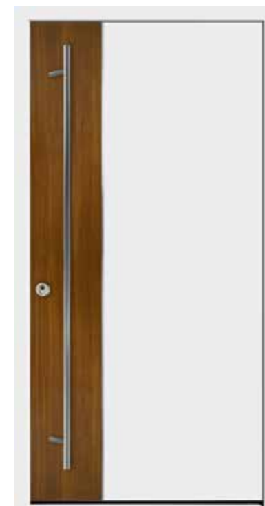
Modell 801 ohne Designsockel Griff SG 136 Farbe RAL 9016 Weiß mit abgesetzter Oberfläche Afrosia

Mit Mehrpreis als Sicherheitstür mit Widerstandsklasse RC2 (nur mit Griff SKDZ 601)