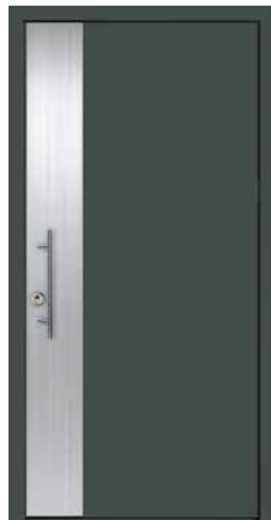
Modell 501 mit Edelstahlapplikation ohne Designsockel Griff SG 135 Farbe RAL 7016 Anthrazitgrau

Mit Mehrpreis als Sicherheitstür mit Widerstandsklasse RC2 (nur mit Griff SKDZ 601)