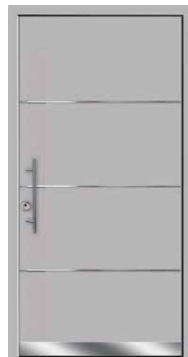
Modell 803 mit Designsockel Griff SG 135 Farbe RAL 7038 Achatgrau

Ohne Mehrpreis als Sicherheitstür mit Widerstandsklasse RC2 (nur mit Griff SKDZ 601)