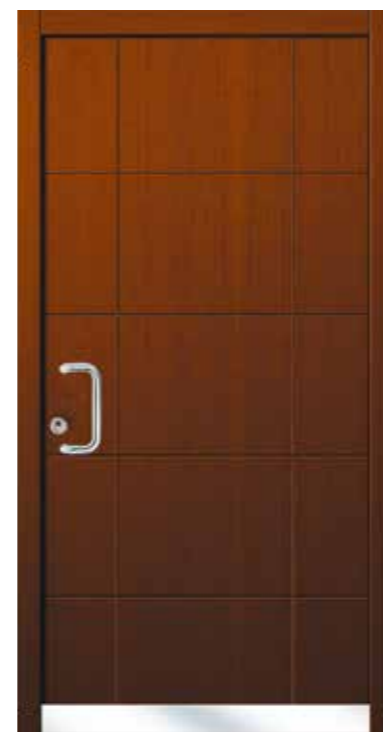
Modell 507 mit Designsockel Griff SG 102 Farbe Nussbaum

Ohne Mehrpreis als Sicherheitstür mit Widerstandsklasse RC2 (nur mit Griff SKDZ 601) Die Abbildung zeigt eine zusätzliche Ausstattung mit Mehrpreis: SG 136.