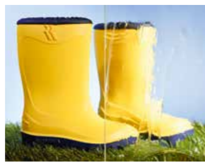
ALTDEUTSCH K WEISS