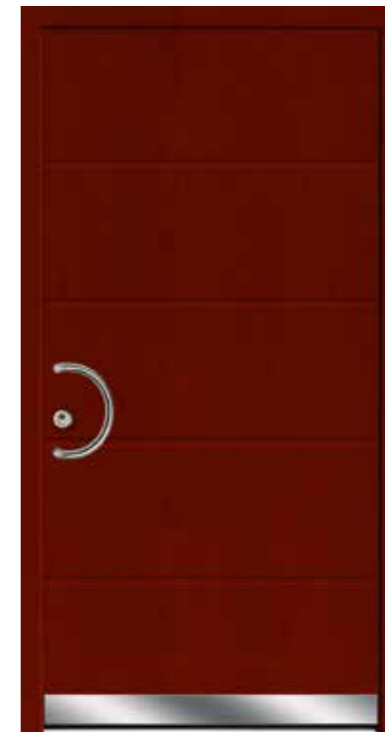
Modell 805 mit Designsockel Griff SG 101 Farbe Teak

Ohne Mehrpreis als Sicherheitstür mit Widerstandsklasse RC2 (nur mit Griff SKDZ 601)