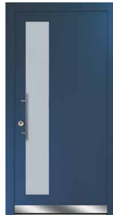
Modell 514 mit Designsockel Glas Satina weiß Griff SG 135 Farbe RAL 5011 Stahlblau

Mit Mehrpreis als Sicherheitstür mit Widerstandsklasse RC2 (nur mit Griff SKDZ 601)